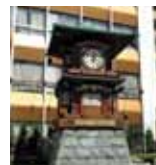
放生園・からくり時計 (徒歩 5分)