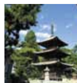
石手寺 (車 5分)