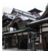
道後温泉本館 (徒歩 3分)