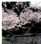
道後公園 (徒歩 5分)