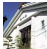
椿の湯 (徒歩 1分)