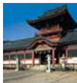
伊佐瀬波神社 (徒歩 10分)